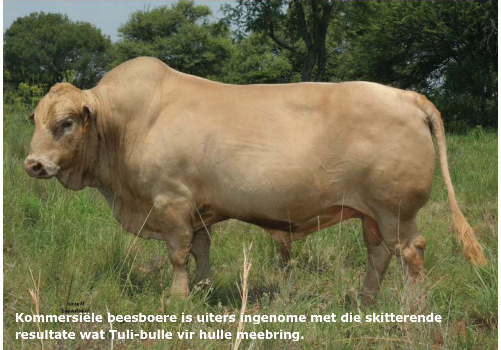
Kommersiële beesboere is uiters ingenome met die skitterende resultate wat Tuli-bulle vir hulle meebring.

lik winsgewend en lekker om met hulle te boer omdat hulle so mak is en so min aandag verg. Hulle sorg vir hulleself. Hy het pas 20 verse aan 'n koper uit Natal verkoop.