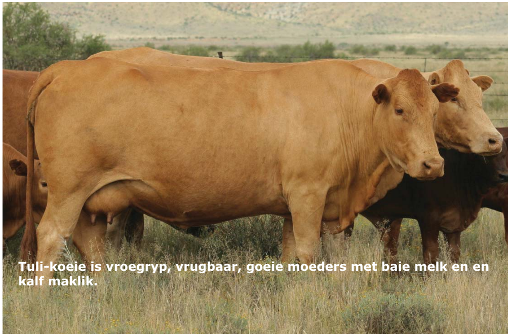
Tuli-koeie is vroegryp, vrugbaar, goeie moeders met baie melk en en kalf maklik.